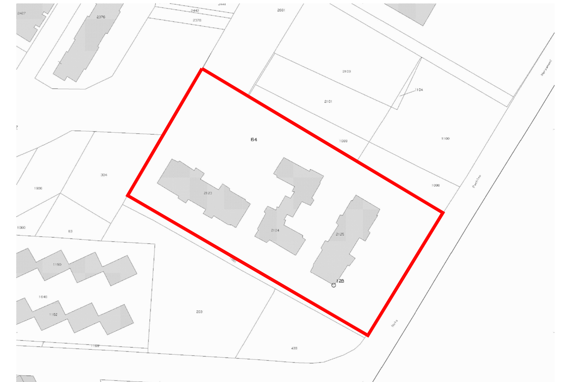
ESTRATTO DI MAPPA CATASTALE SCALA 1:1000