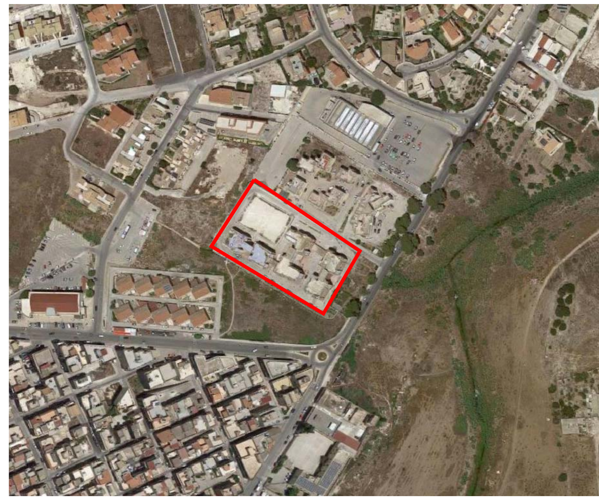
ESTRATTO FOTO SATELLITARE SCALA 1:2000