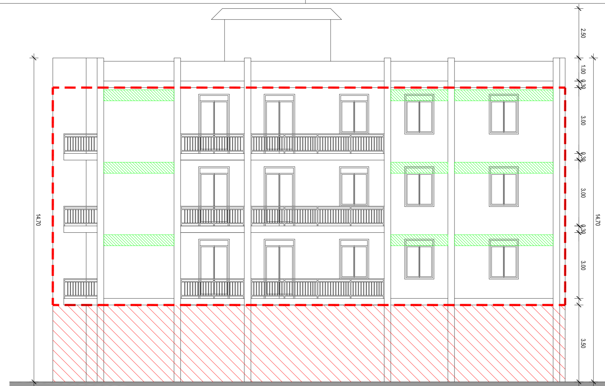
PROSPETTO NORD SCALA 1:100