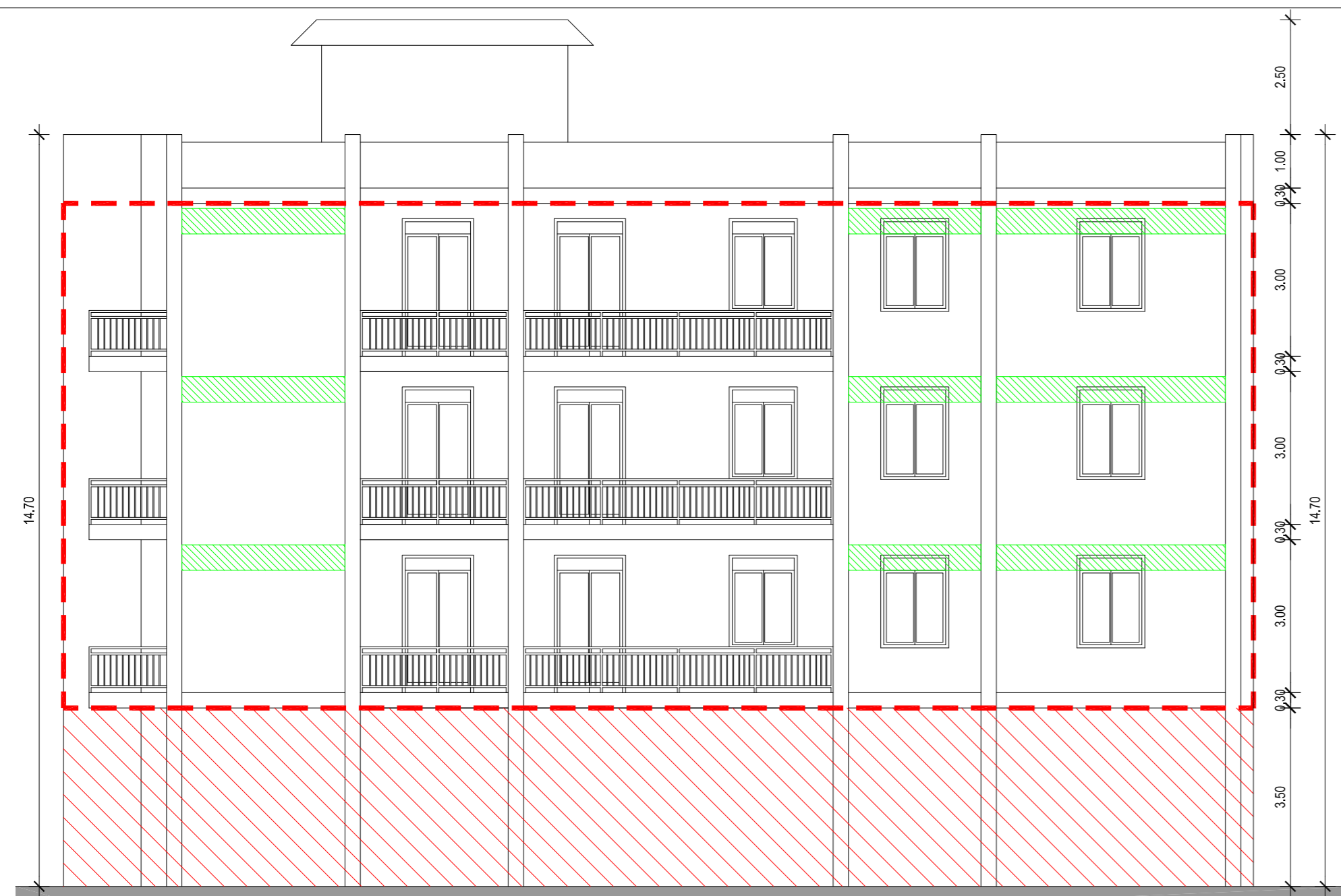
PROSPETTO SUD SCALA 1:100