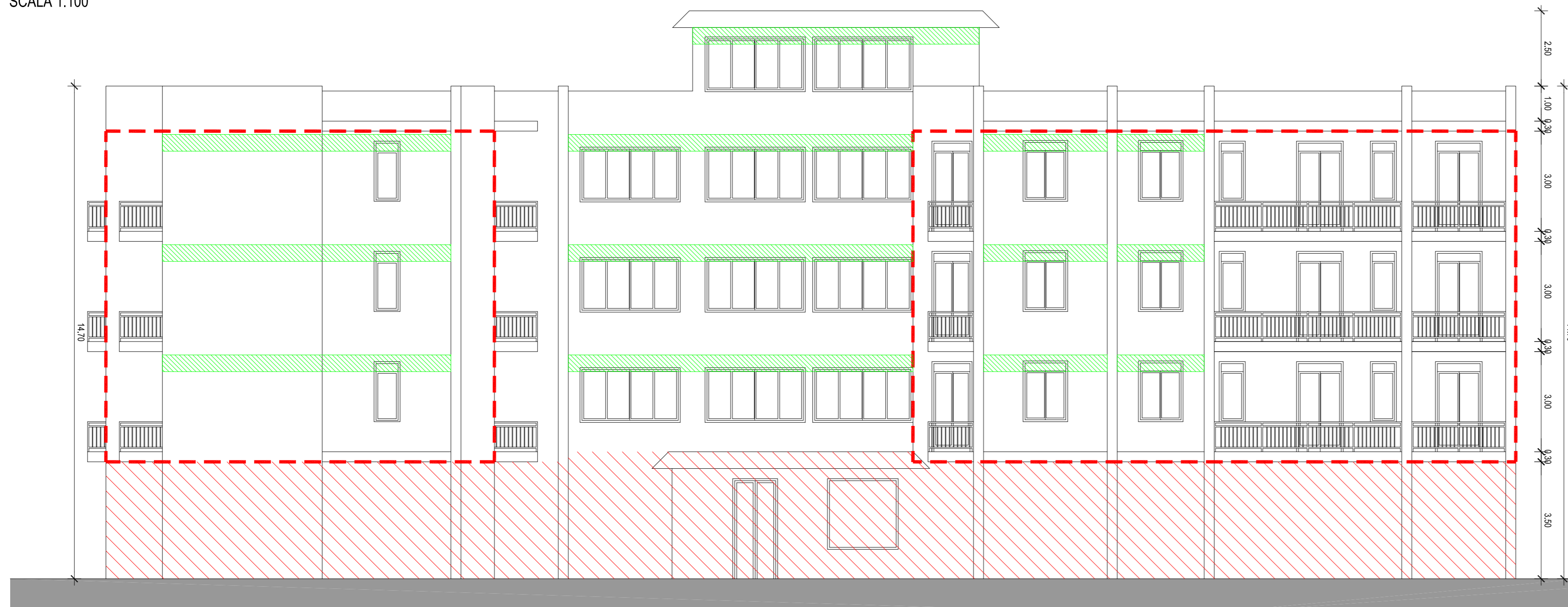
PROSPETTO EST SCALA 1:100