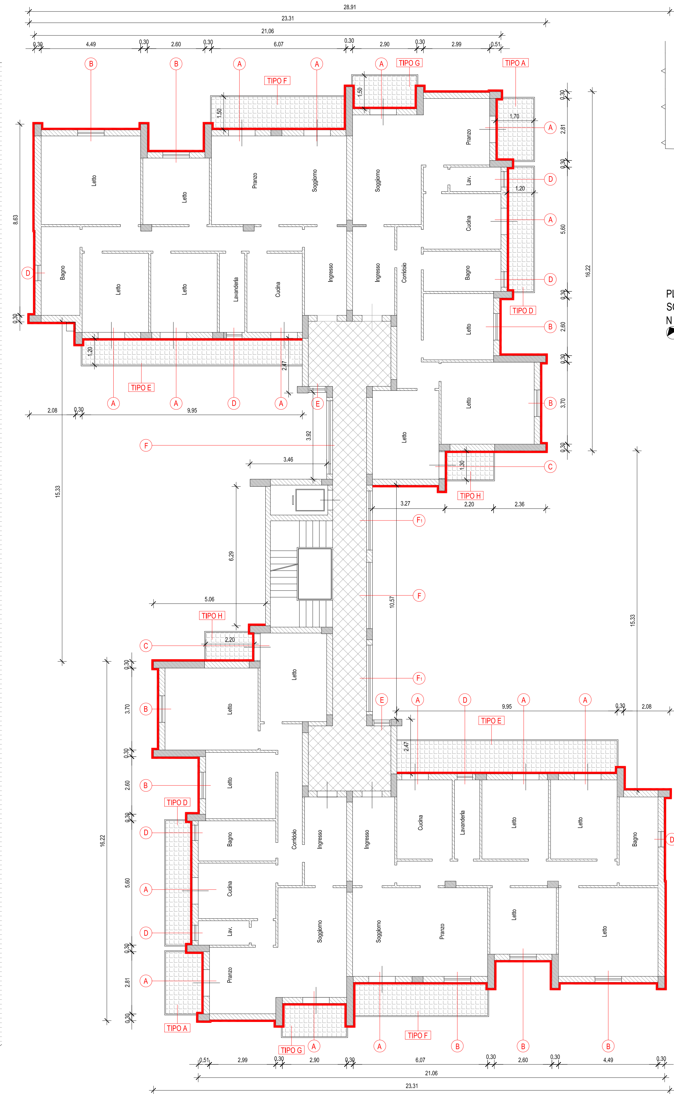
PIANTA PIANO TIPO SCALA 1:100