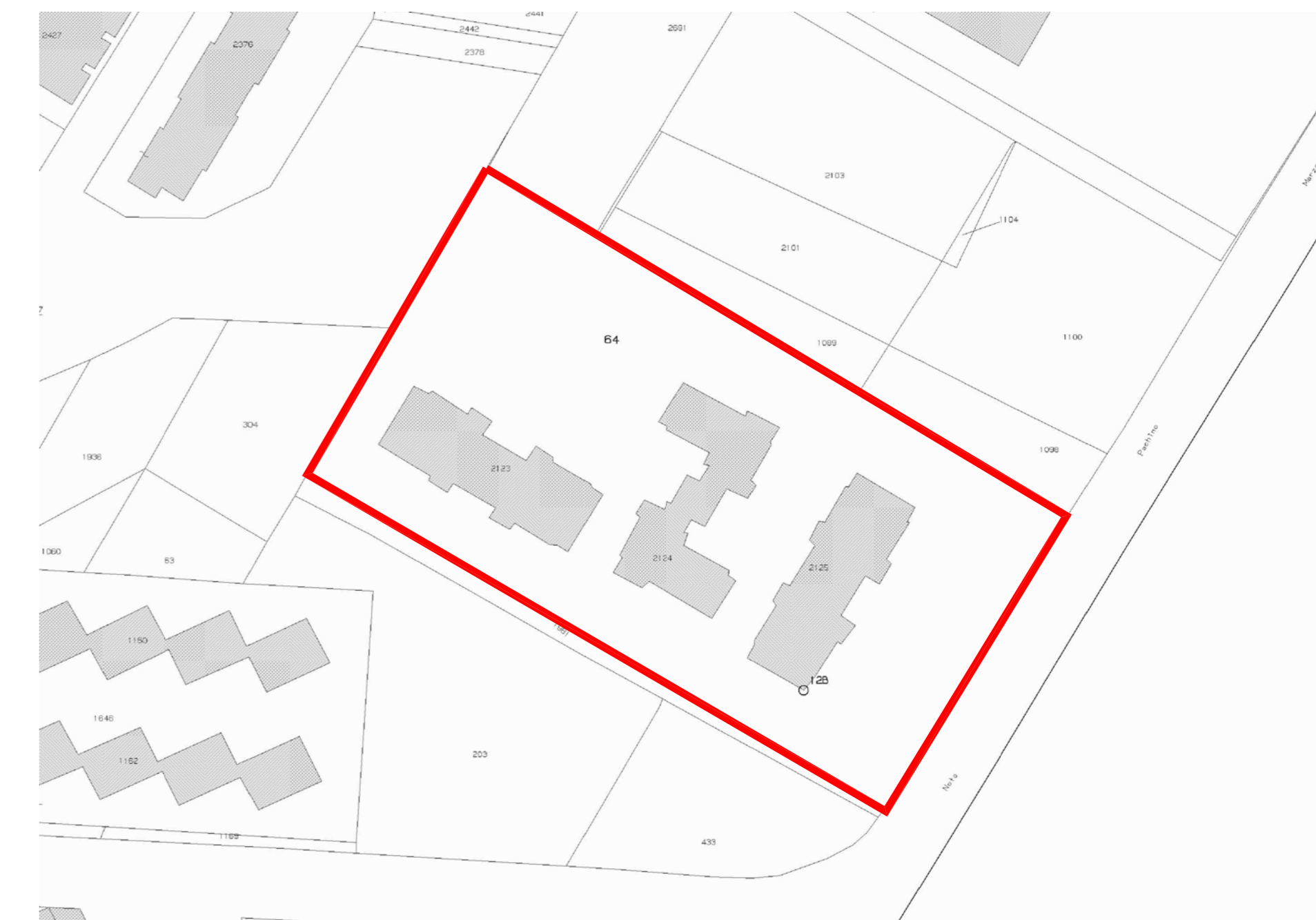
ESTRATTO DI MAPPA CATASTALE SCALA 1:1000